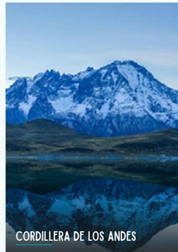
CORDILLERA DE LOS ANDES